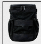
Κωδ.: 0815779 Τσάντα Μεταφοράς