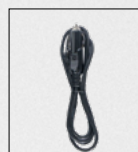
Κωδ.: 0815776 Τροφοδοτικό Αυτοκινήτου