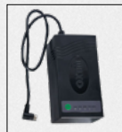
Κωδ.: 0815777 Εξωτερική Μπαταρία